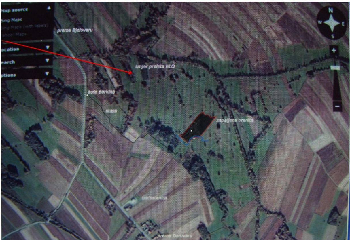
Snimak iz zraka