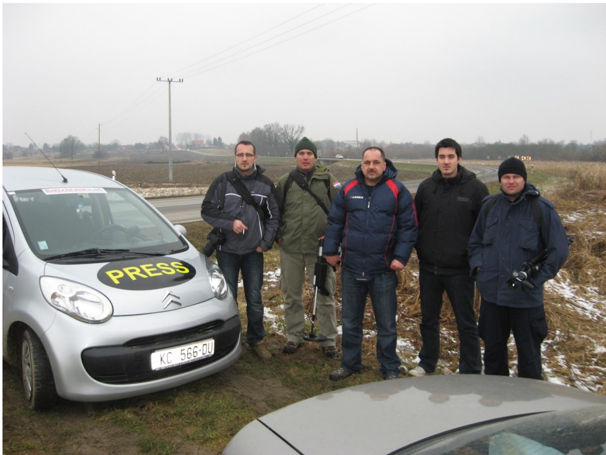
S novinarima Bjelovarskih novina