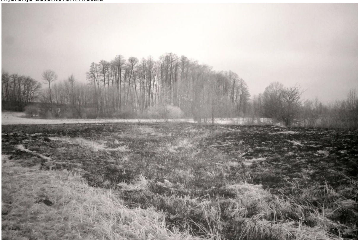
Slikano IC aparatom FUJI FILM Pro