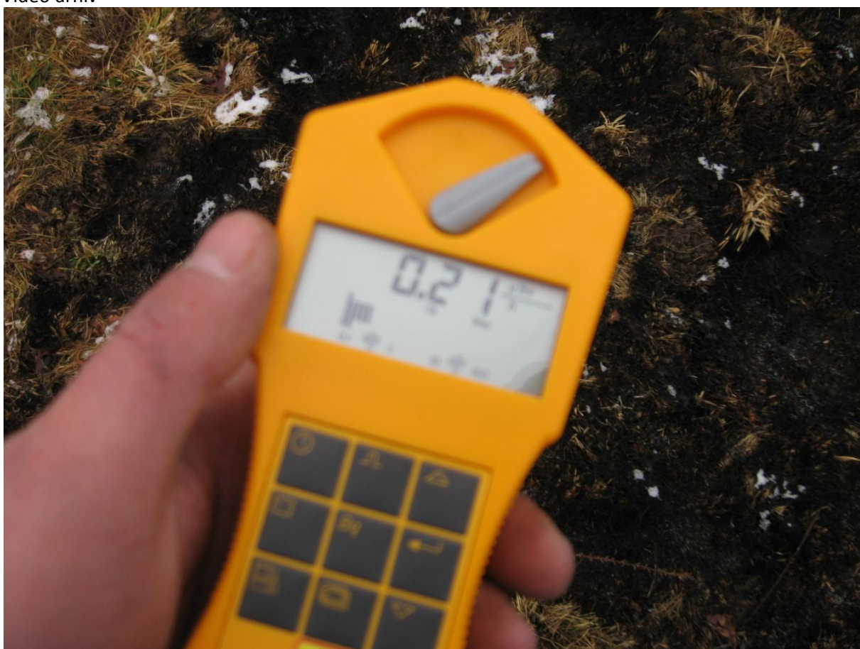
Mjerenje geigerovim brojačem