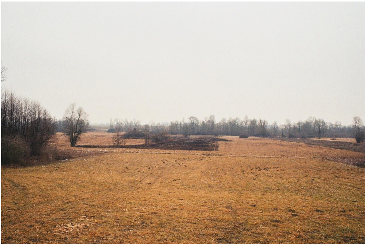
Izgoreni dio njive