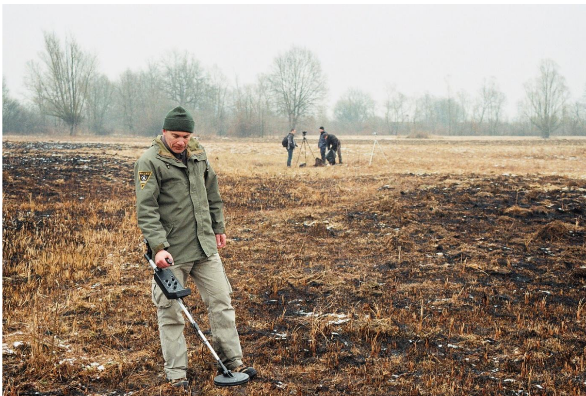
Mjerenje detektorom metala